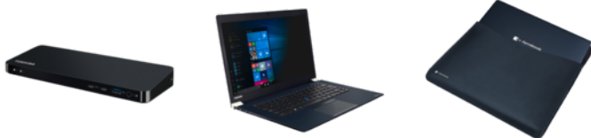
Thunderbolt 3-Dockingstation (PA5281E-2PRP)