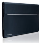
Portégé X20W-D Sleeve (PX1899E-1NCA)